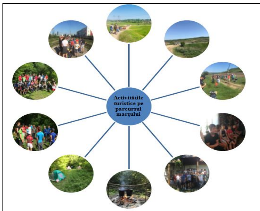
Figura 2. Activitățile turistice pe parcursul marșului

Pe parcursul itinerarului adolescenții au fost implicați în diverse activități cu caracter turistic ( figura 2 ), care au cuprins procesul de integrare a adolescenților în aer liber: însușirea mișcărilor și sarcinilor din cadrul programului de marș, observarea și interpretarea evoluției grupului.