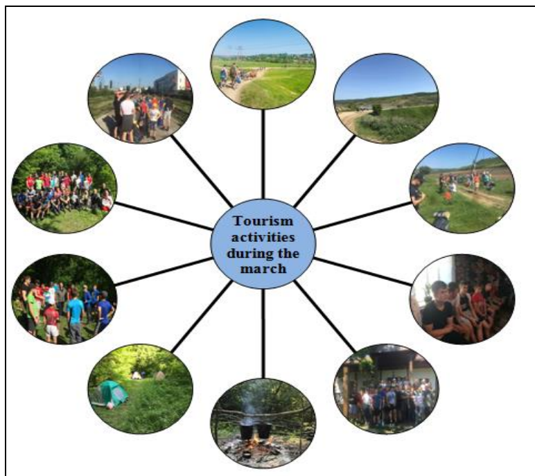
Figure 2. Tourism activities during the march

Each activity was designed to exceed the expectations of the participants but the socialization factor had to occupy the primary place as an important part of the activity of the tourist march.