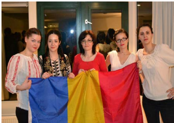
Cultural Market - Programul intensiv Community Based in Mental Health - Nijmegen

( http://eur-lex.europa.eu/LexUriServ/LexUriServ.do?uri=OJ:L:2006:327:0045:0068:EN:PDF ).