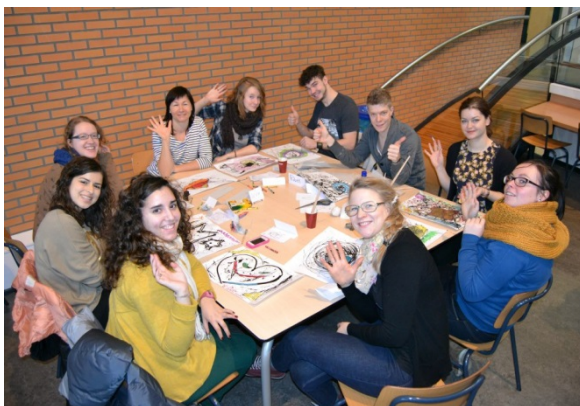
Workshop Body and mind - Programul intensiv Community Based in Mental Health - Nijmegen