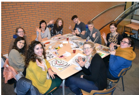
Workshop Body and mind - Programul intensiv Community Based in Mental Health - Nijmegen

predare care nu au fost familiare tuturor cadrelor didactice și aspectele legate de tutoriat au fost mereu discutate în ședințe destinate exclusiv profesorilor și s-au desfășurat în paralel sau la sfârșitul programului zilnic.