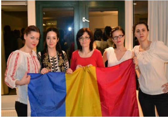
Cultural Market - Programul intensiv Community Based in Mental Health - Nijmegen

LLP is divided in four sectorial sub programmes and four so called 'transversal' programmes: Comenius for schools, Erasmus for higher education, Leonardo da Vinci for vocational education and training, Grundtvig for adult education” ( http://eacea.ec.europa.eu )